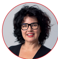
Mirjam Stauffer Présidente Physioswiss

Le frein aux coûts plafonnerait les dépenses de santé en fonction de la conjoncture économique. Avec un mécanisme aussi absurde, c'est justement en période de pandémie qu'il faudrait restreindre le plus strictement l'accès aux soins.